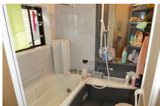
浴室(給湯器、浴室暖房)