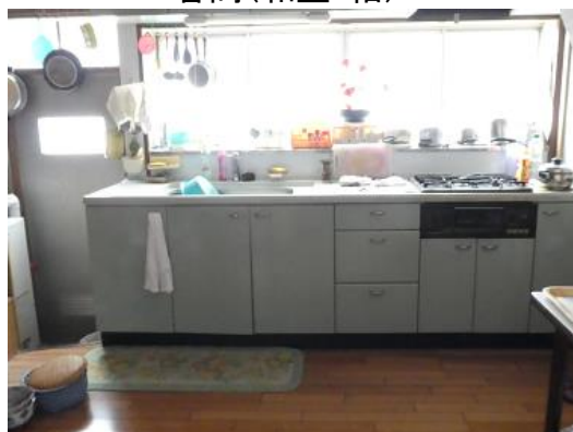
台所(ダイニングキッチン)