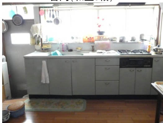
台所(ダイニングキッチン)